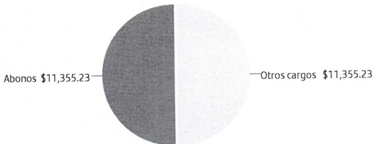
Gráfico cuenta de cheques.