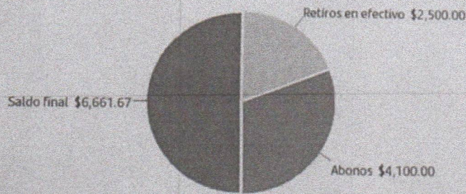
Gráfico cuenta de cheques. SUPER NOMINA No. de cuenta 56-87944905-6 Saldo inicial $5,061.67